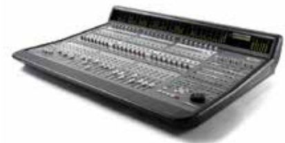
Uso de mesas de grabación