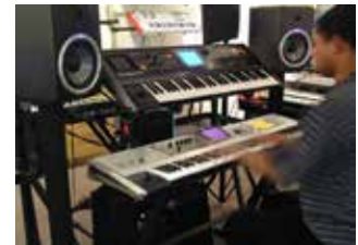
Técnicas de grabación