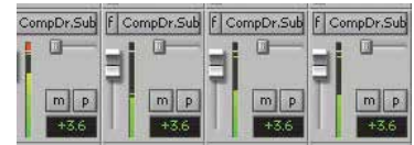
Edición digital de sonido.