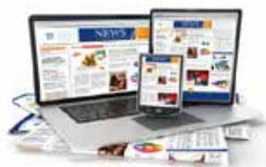
Realizar diagramación editorial y publicaciones digitales para diferentes tipos de soporte