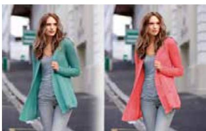
Realizar corrección de color