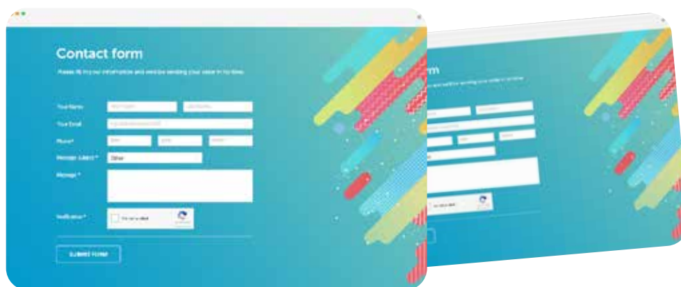
Crear Formularios de contacto