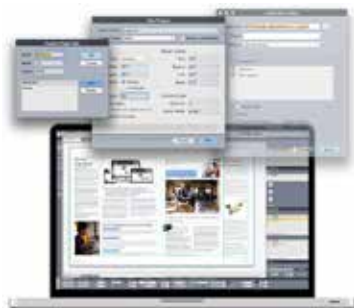
Diagramación editorial y publicaciones digitales para diferentes tipos de soporte