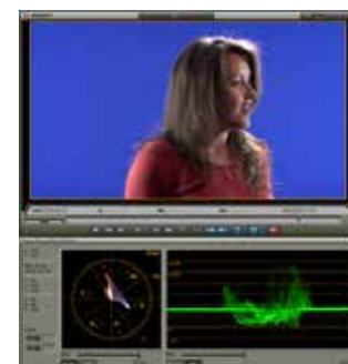
CORRECCION DE COLOR PARA CINE y TV EN STANDARES SD, HDV, HDTV, UHD

Integrar las grabaciones al software para crear efectos visuales de nivel profesional.