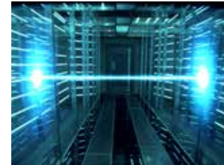
APLIQUE EFECTOS A SUS PRODUCCIONES AUDIOVISUALES