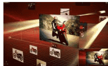
Efectos 3D con luces, cámaras y sombras

Integrar las grabaciones al software para crear efectos visuales de nivel profesional.