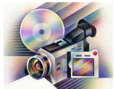
DISEÑE y CREE MENU'S INTERACTIVOS