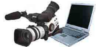
TRASPASE SONIDO Y VIDEO A CD-DVD