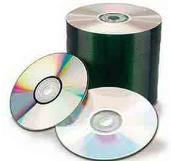
CONOZCA LOS METODOS DE COMPRESION