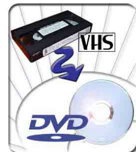
TRASPASE CINTAS DE VIDEO A FORMATO OPTICO