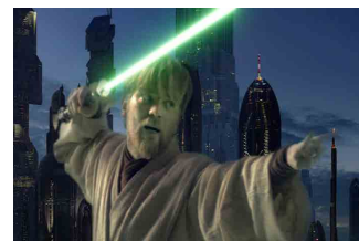
Aplicaciones en terreno de efectos visuales