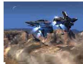
Inserte a sus ediciones de video, sorprendentes efectos visuales

Acceso a la más moderna plataforma de educación virtual online sincrónica y asincrónica en www.dgmonline.cl