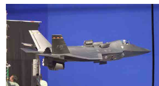
Efectos de Chroma con grabaciones en terreno - sala de chroma