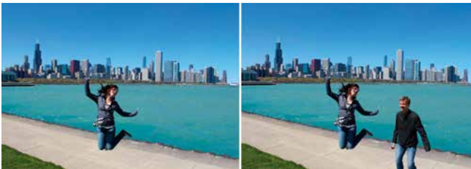
Eliminar elementos de escenas