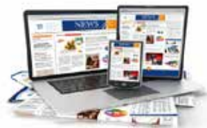
Realizar diagramación editorial y publicaciones digitales para diferentes tipos de soporte