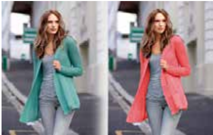
Realizar corrección de color